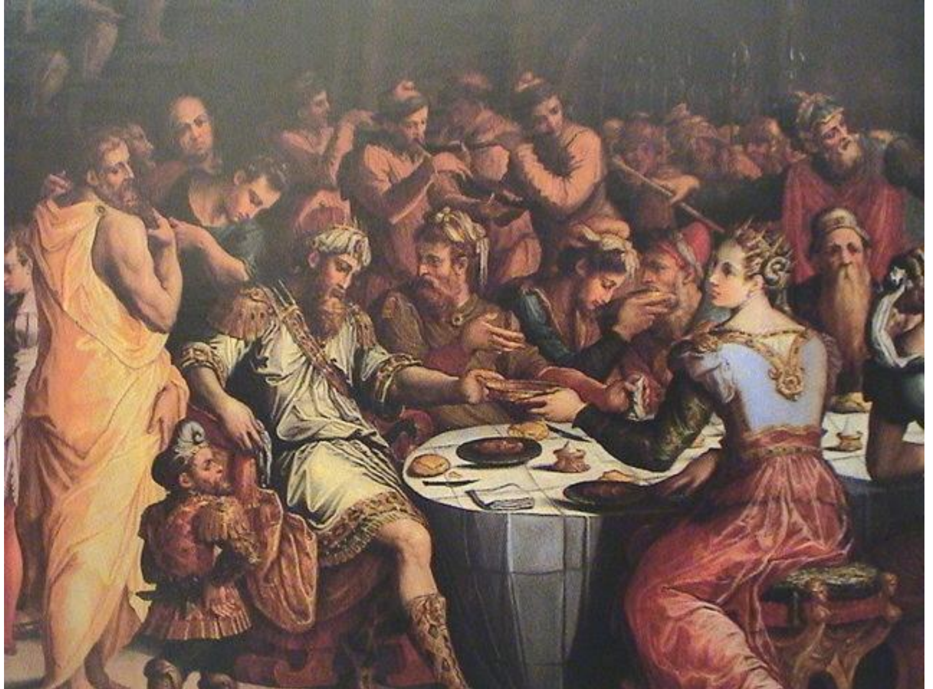
Giorgio Vasari, Nozze di Ester e Assuero (part.)