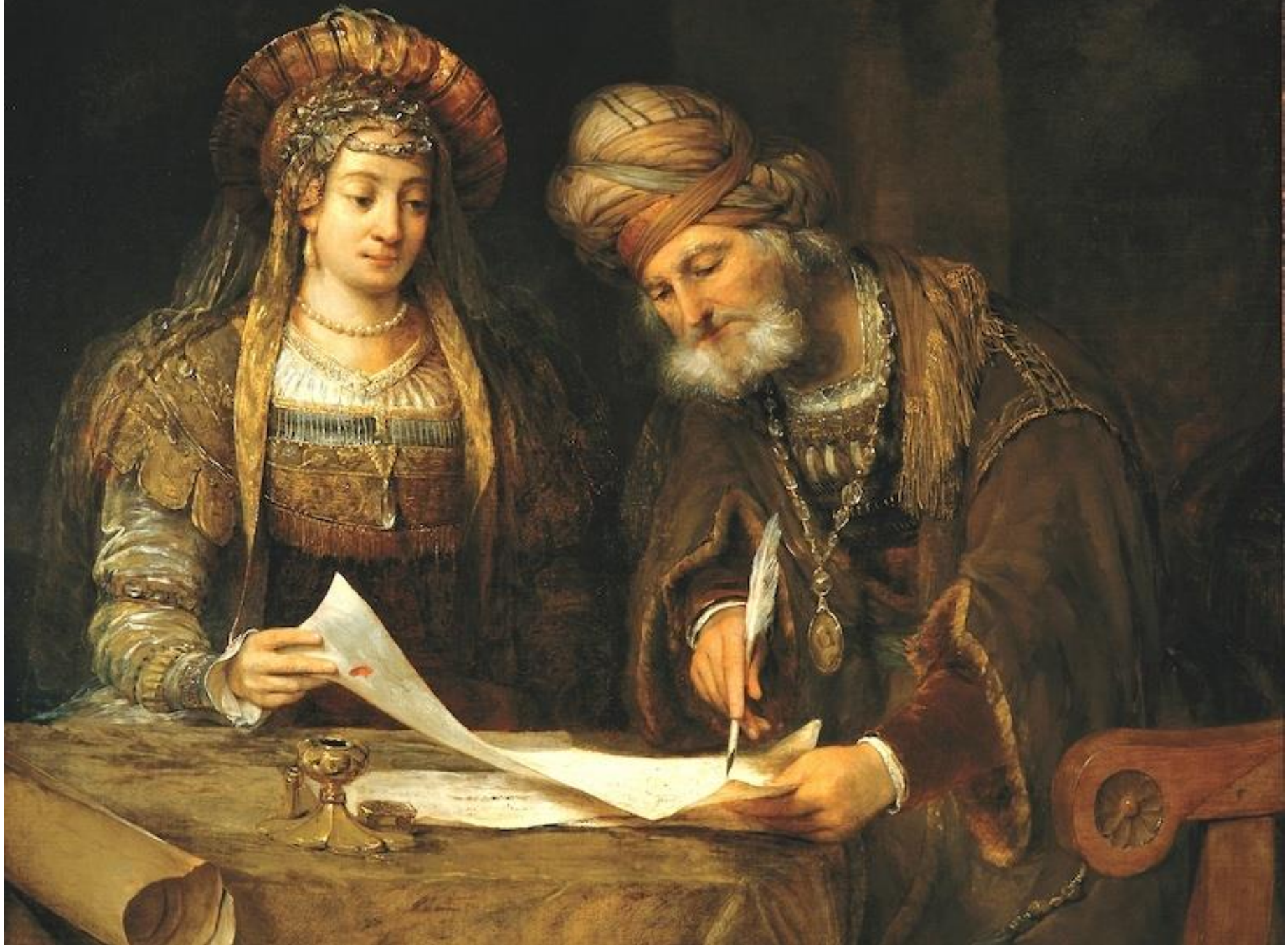
Aert de Gelder, Ester e Mardocheo