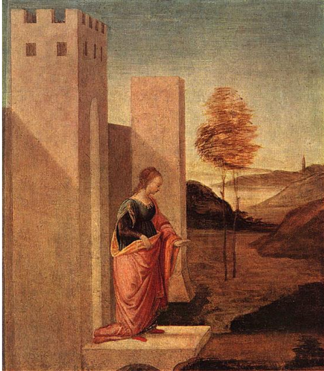
Filippino Lippi, La regina Vasti scacciata da Susa