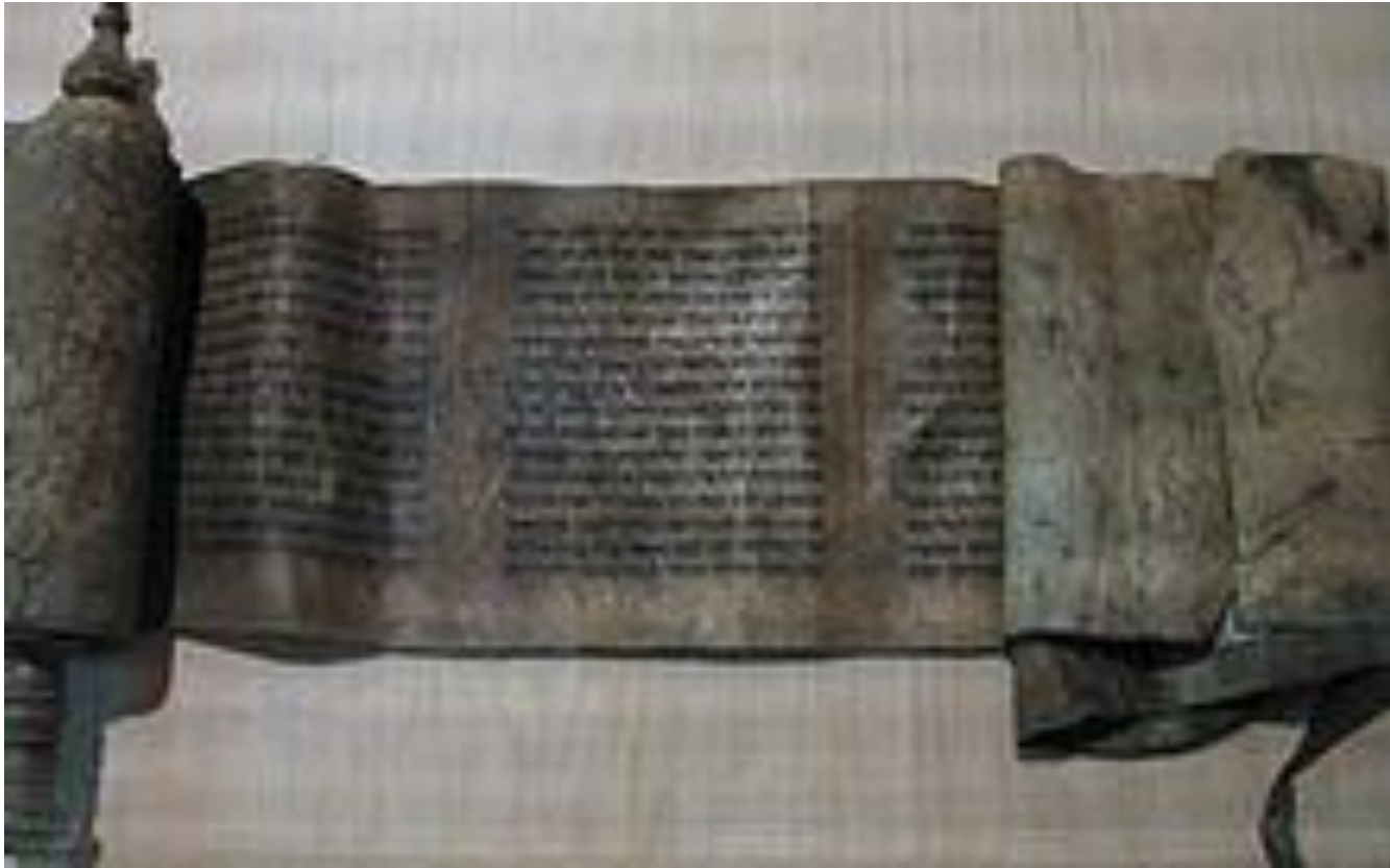
Un rotolo di libro di Ester di Fes, Marocco, risalente al XIII o al XIV secolo, Musée du quai Branly, Parigi