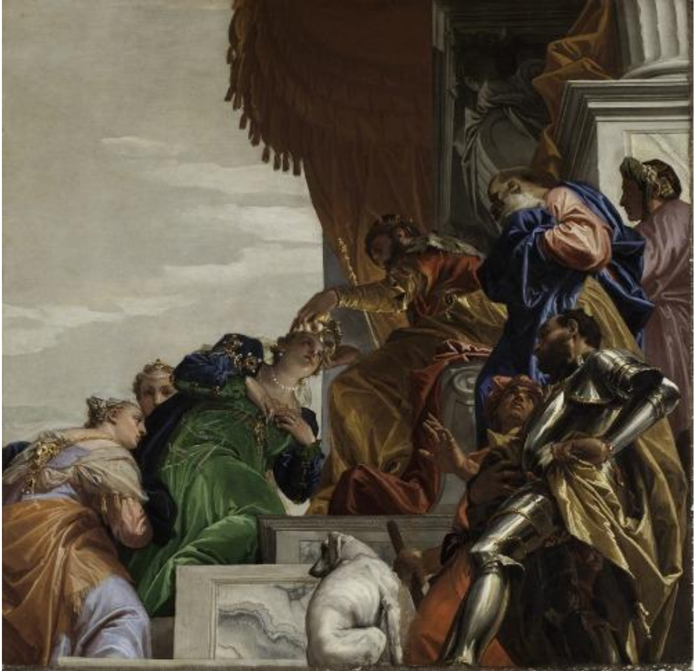
Paolo Veronese, Incoronazione di Ester