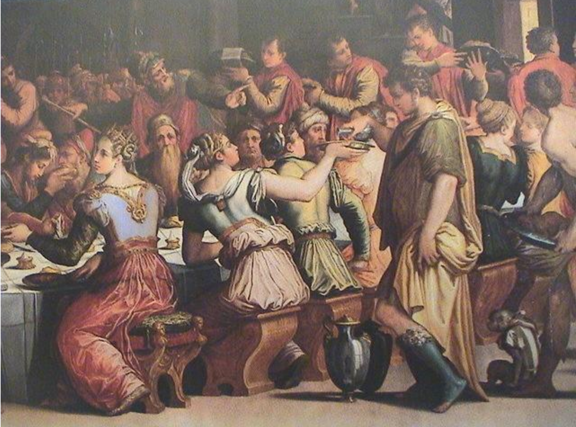
Giorgio Vasari, Nozze di Ester e Assuero (part.)