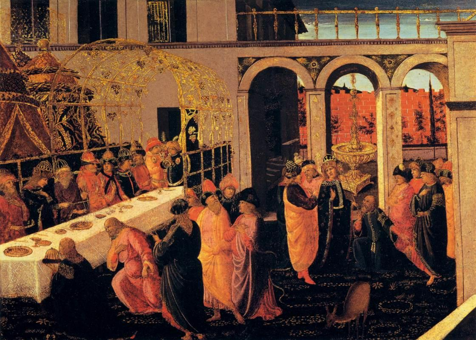
Jacopo del Sellaio, Banchetto di Assuero (Uffizi)