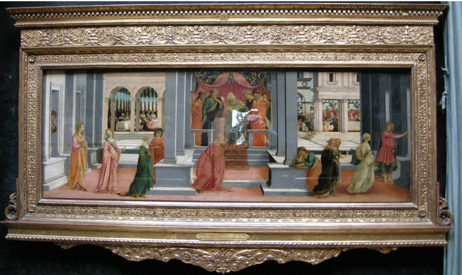
Filippino Lippi, La scelta di Ester