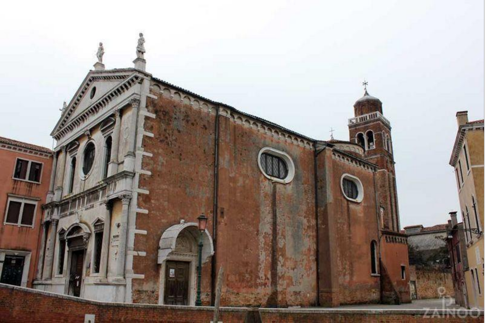
Chiesa di San Sebastiano, Venezia