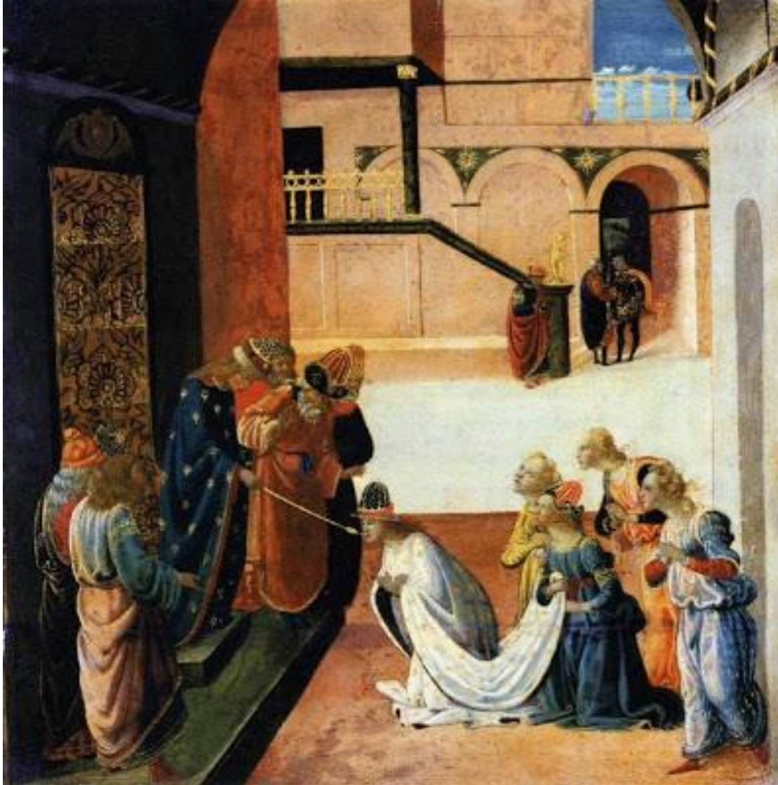
Jacopo del Sellaio, La scelta di Ester (Budapest) 1490 ca