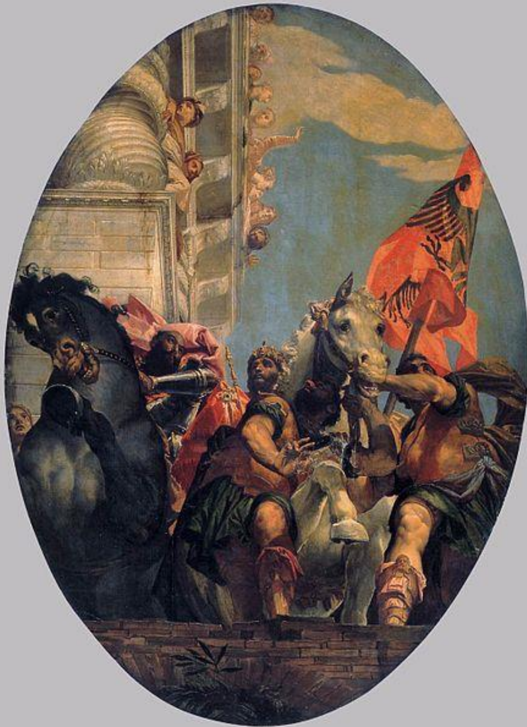
Paolo Veronese, Trionfo di Mardocheo