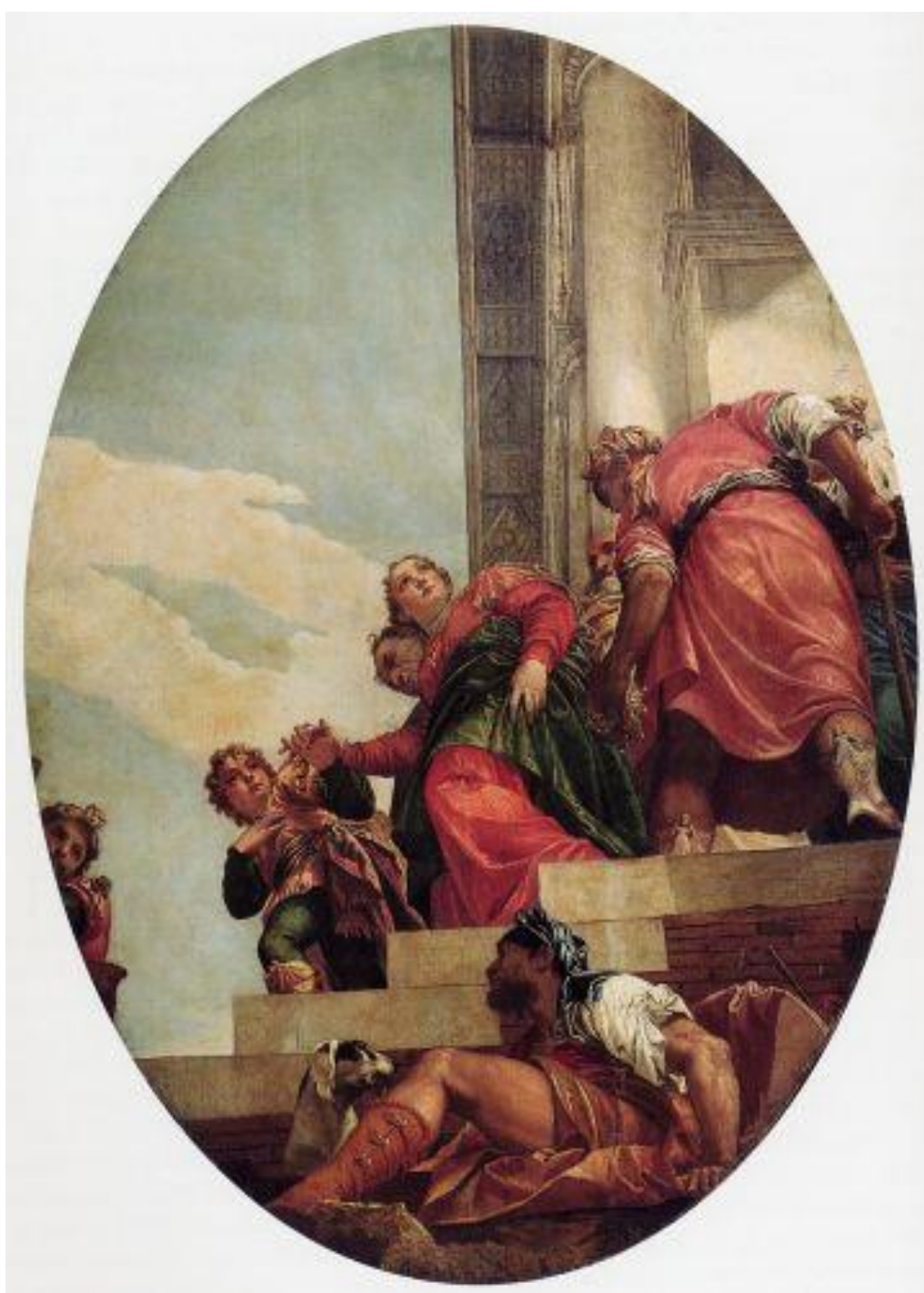
Paolo Veronese, Ripudio di Vasti