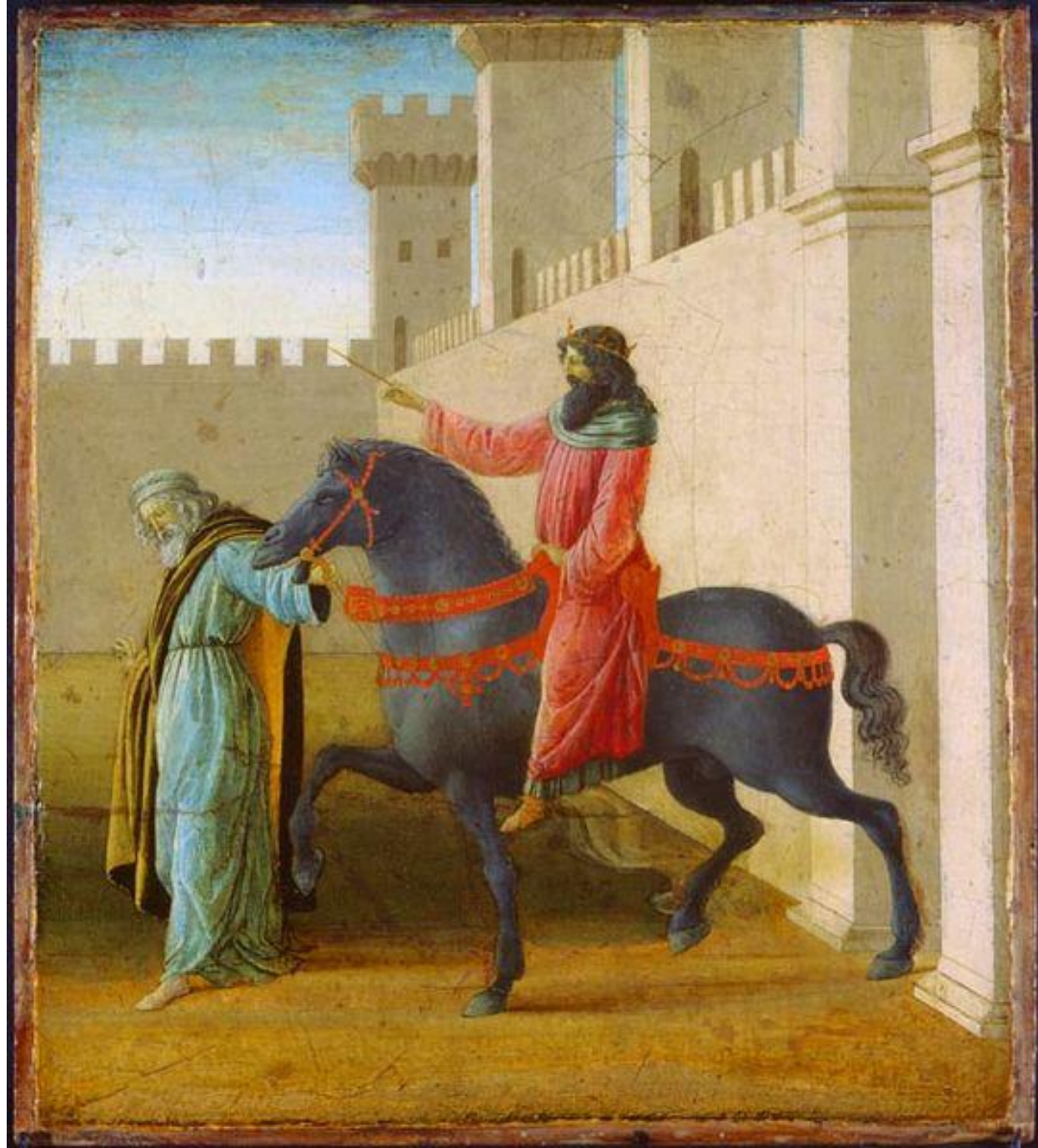
Filippino Lippi, Trionfo di Mardocheo