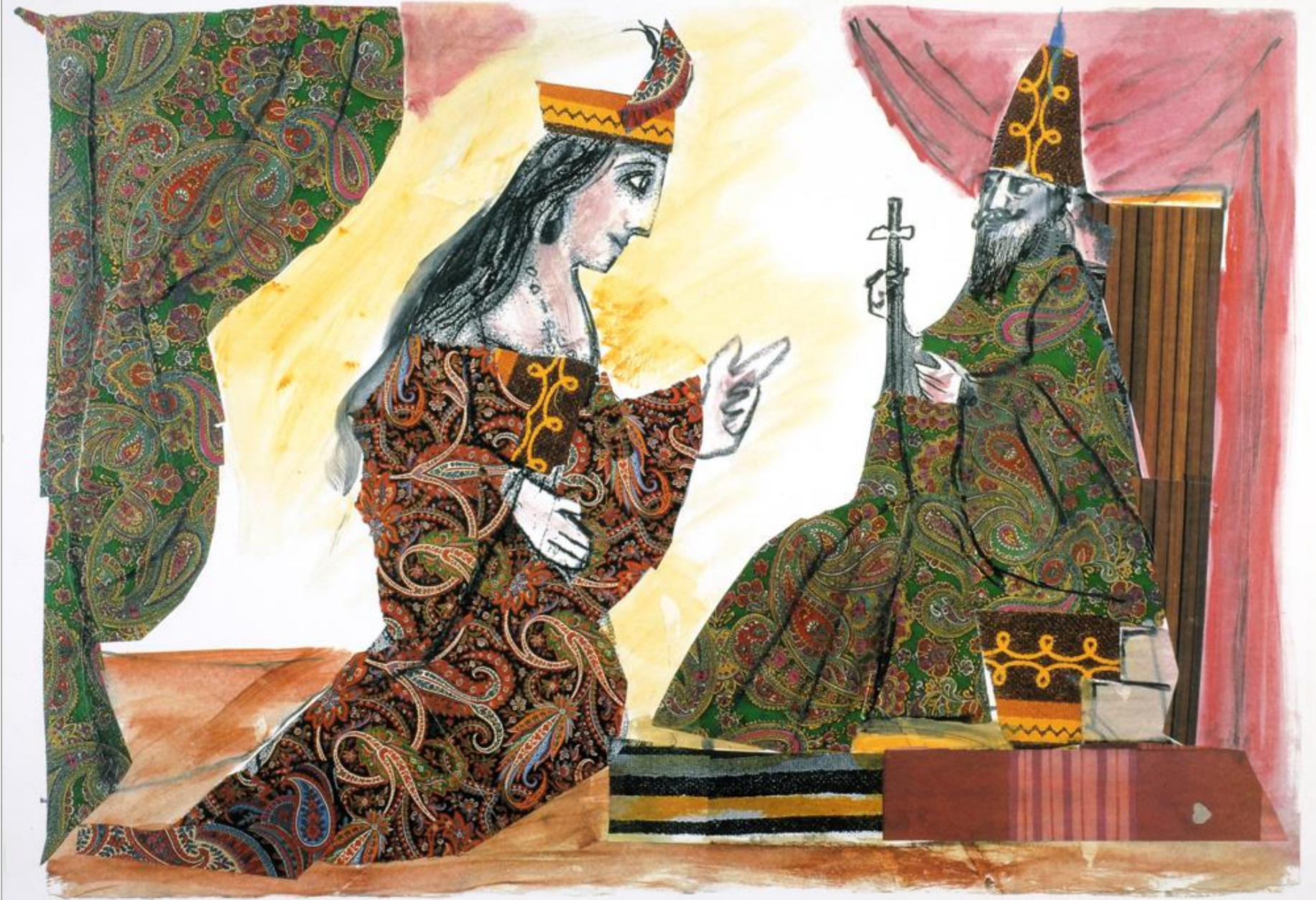
Emanuele Luzzati, Vasti e Assuero