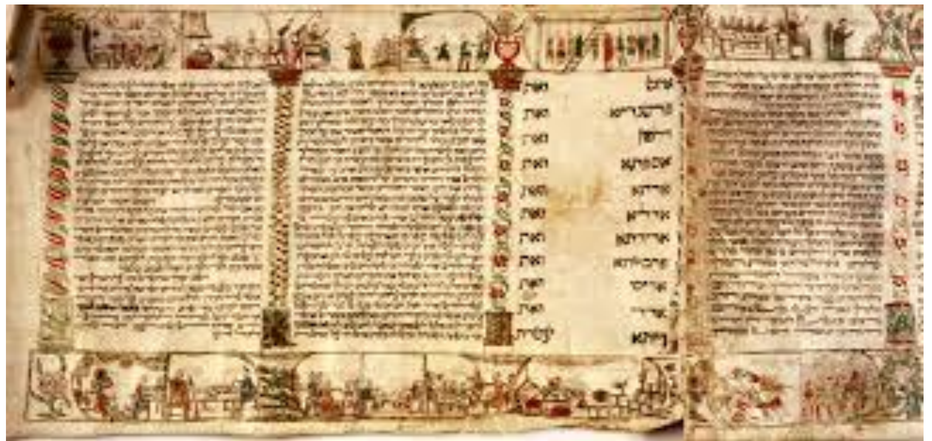
Handwritten text with engraved and hand-colored border Parchment, 3 membranes, 19 text columns, 156.8x17 cm Wooden roller 52.5 cm U. Nahon Museum of Italian Jewish Art