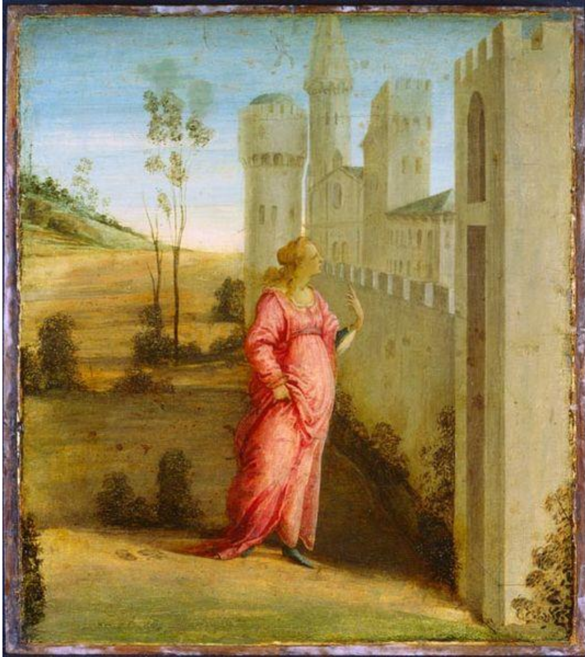
Filippino Lippi, Ester davanti alle mura di Susa