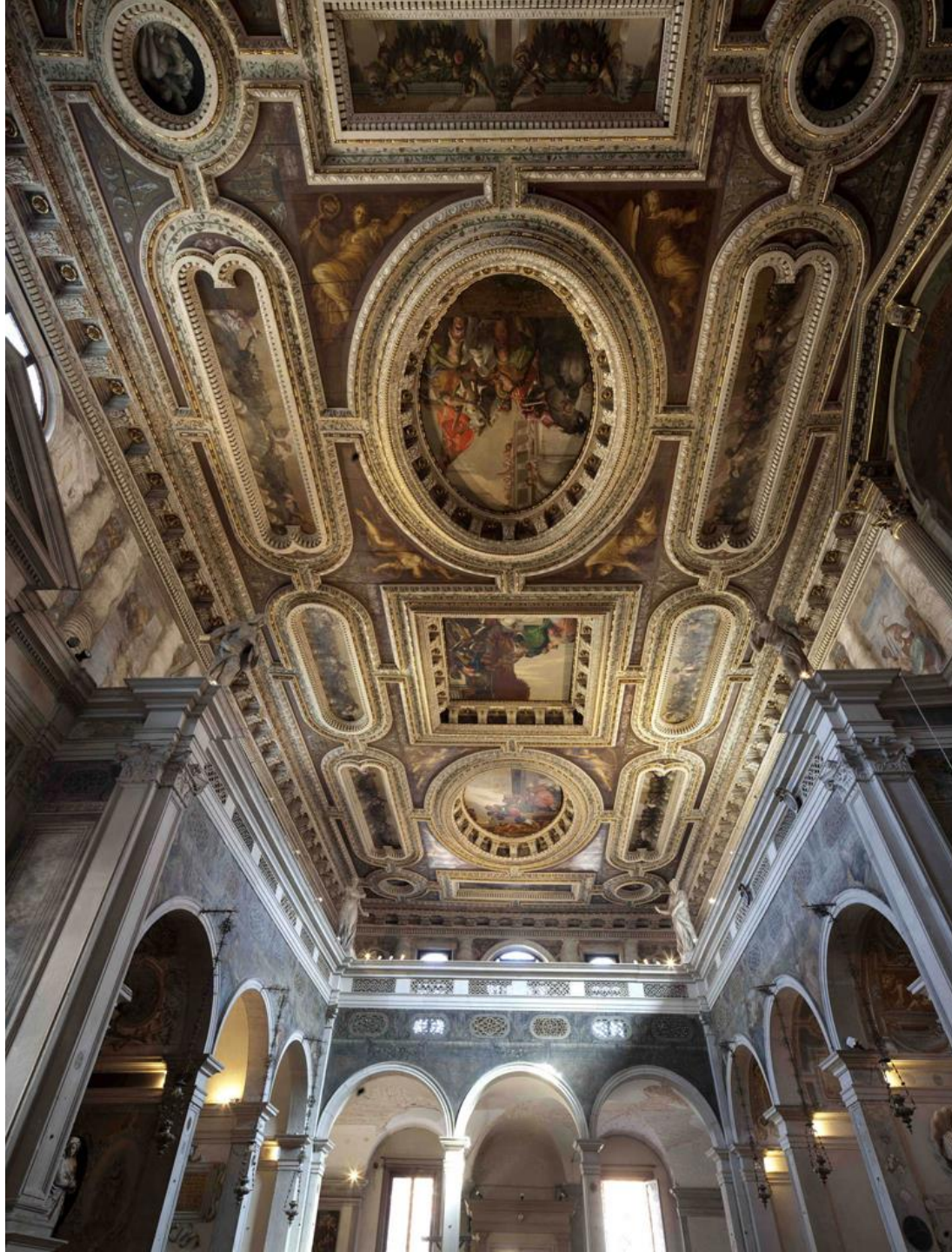
Chiesa di San Sebastiano Interno