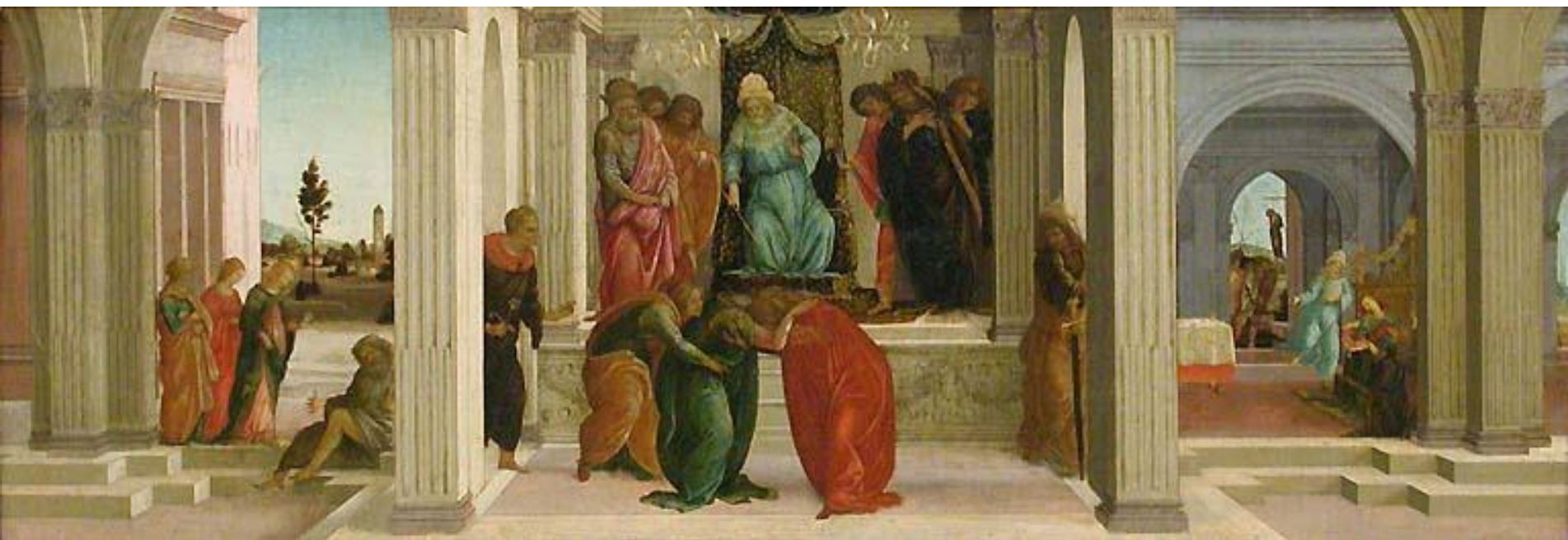
Filippino Lippi, Lo svenimento di Ester