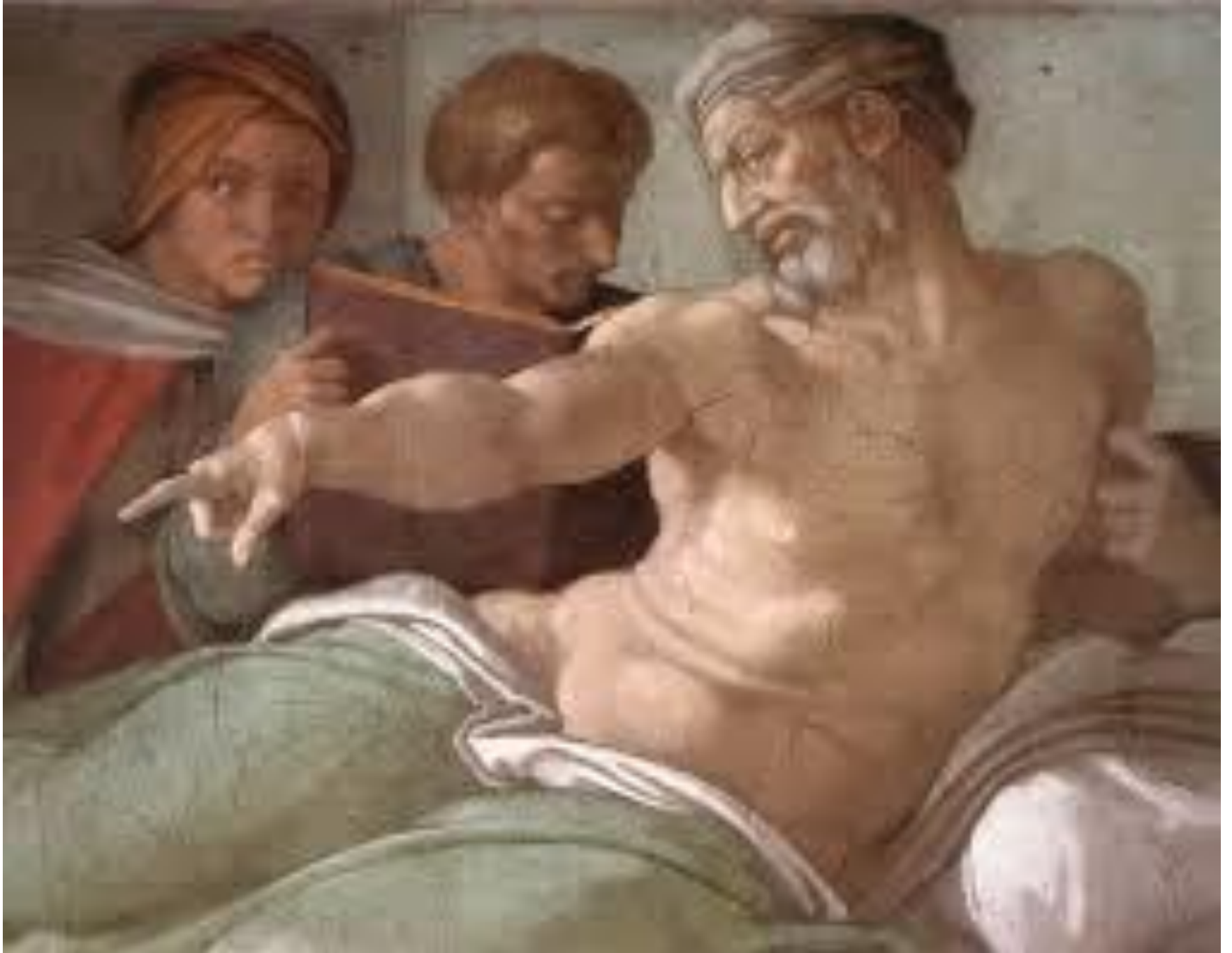
Michelangelo, Punizione di Aman (Cappella Sistina)