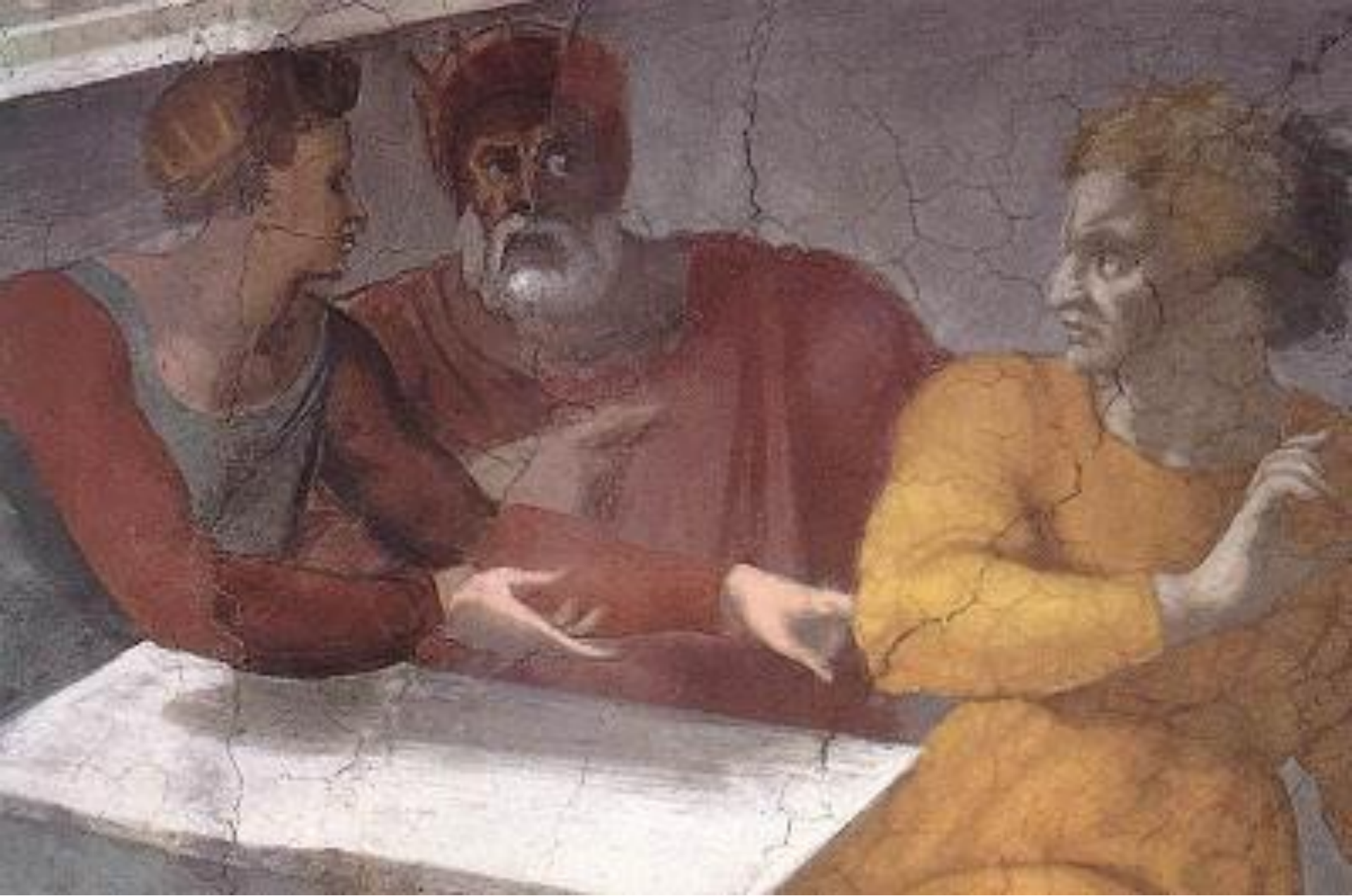
Michelangelo, Ester e Assuero e Aman (Cappella Sistina)