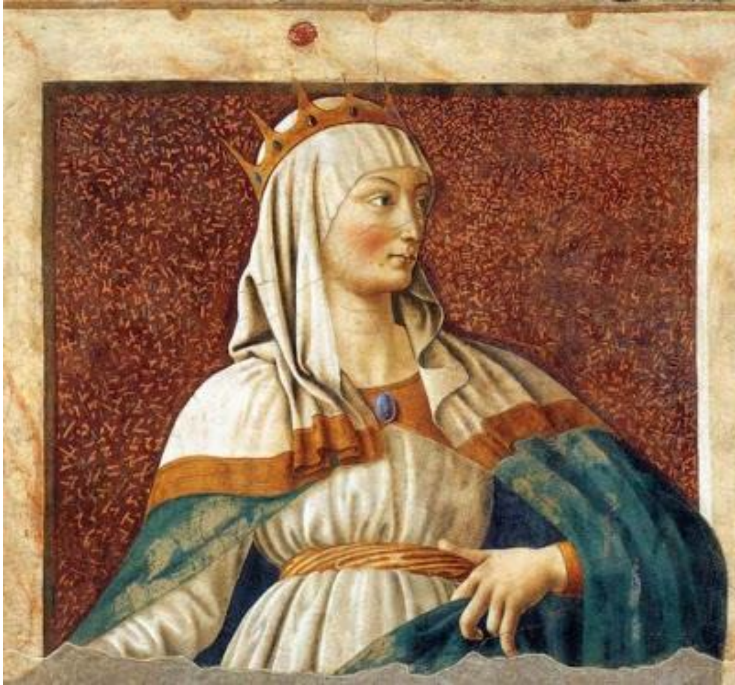
Andrea Del Castagno, La Regina Ester (c. 1450) Uffizi, Firenze