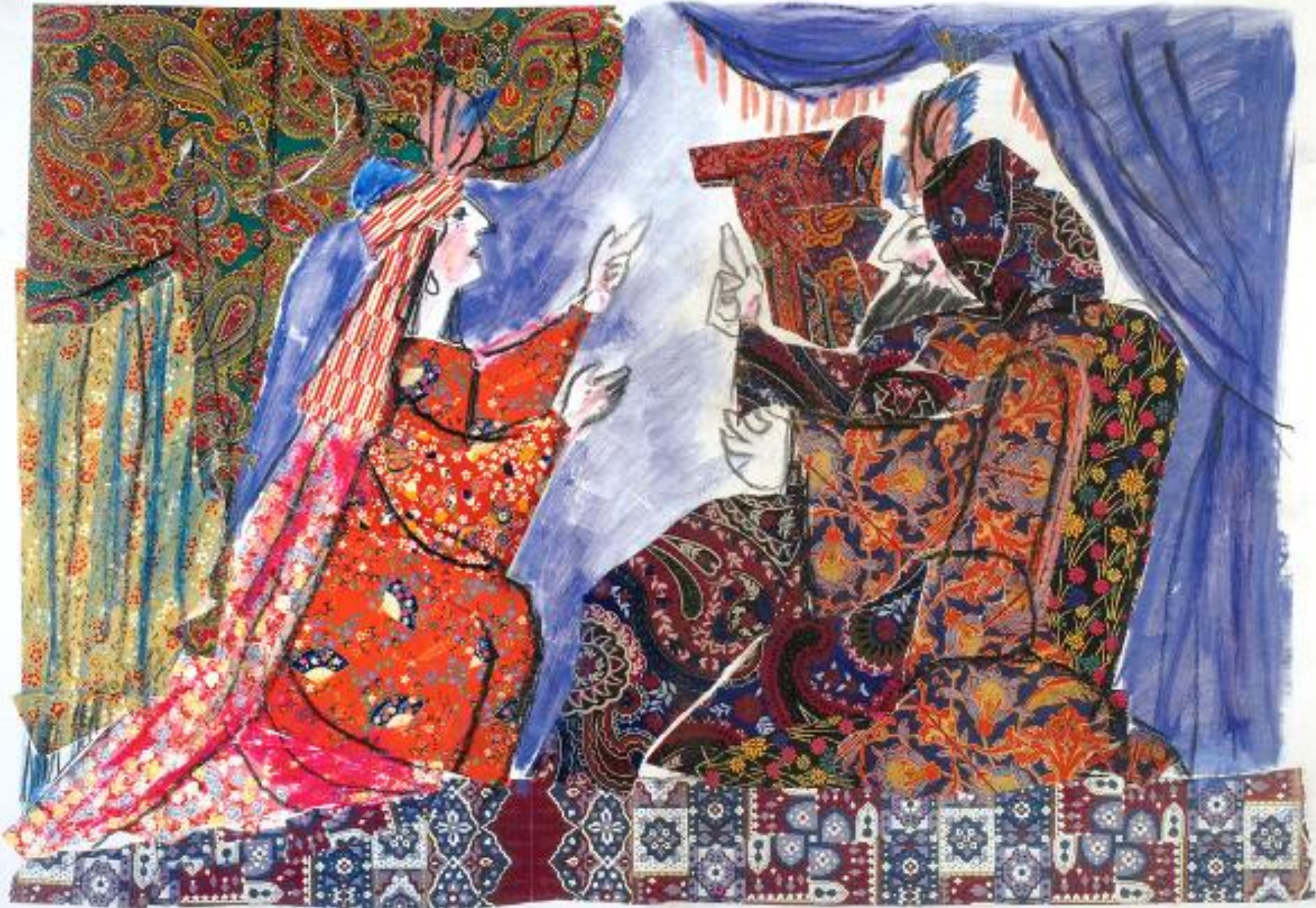
Emanuele Luzzati, Ester e Assuero