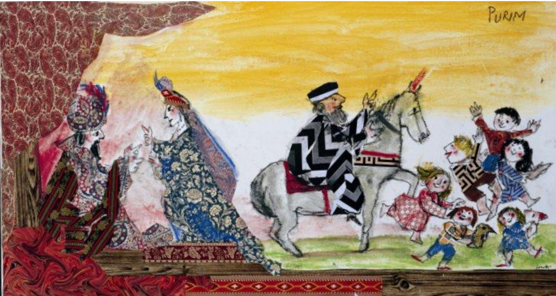
Emanuele Luzzati, Festa di Purim