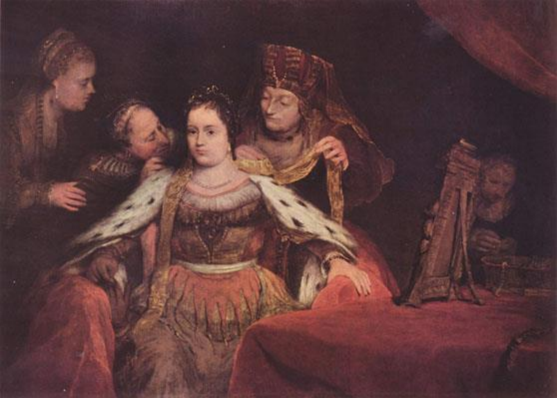
Aert de Gelder, La sposa ebrea