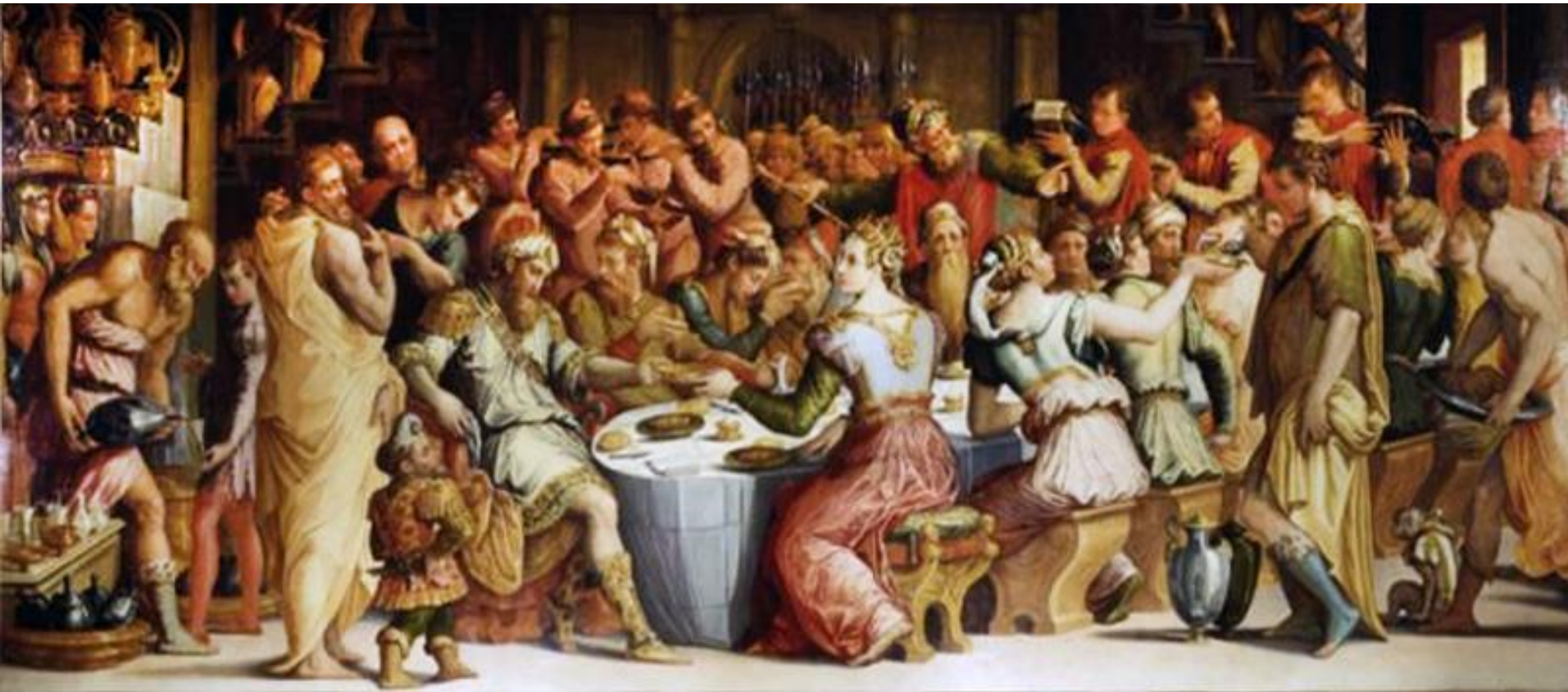
Giorgio Vasari, Nozze di Ester e Assuero