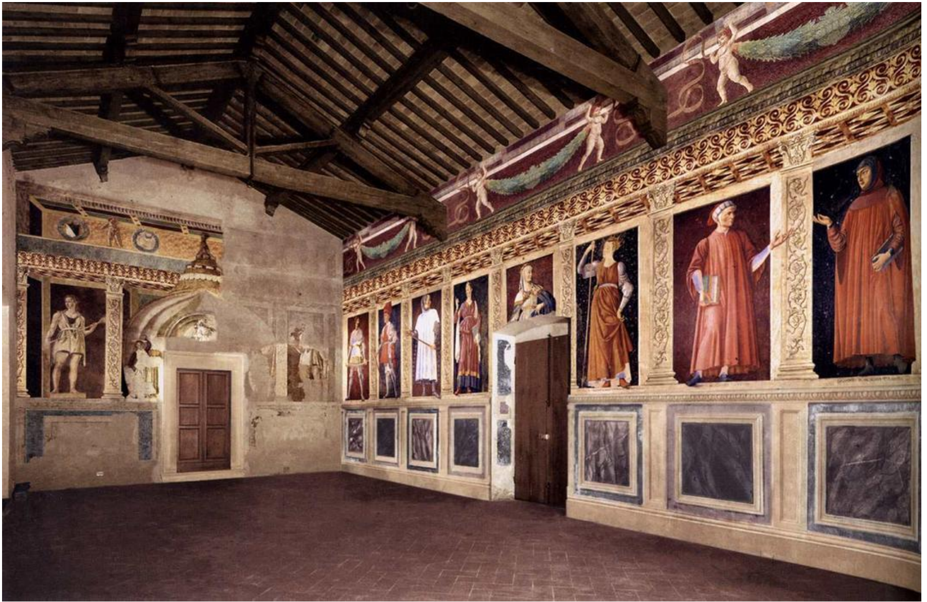
Andrea Del Castagno, villa Carducci di Legnaia, ciclo degli uomini illustri