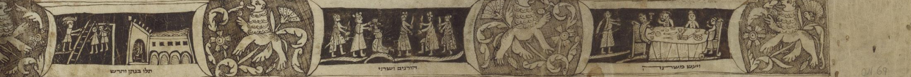
Rotolo di Ester Venezia, tardo XVIII secolo

אסתר את עמה ואת מולדתה כי מרדכי צוה עליה אשר לא תלך ובכל יום ויום מרדכי מתהלך לפני חצר ביד הנשים ליעת את שמים אסתר ומדע ויעשה בה ויבדלנה תה לנדה ולעלד לזכות אל המלך אחשורוש מקץ חודש מה בדת הנשים שלום עשר חודש כי כן ימלאו זמן מוקדון ששה חודשים בשלשן הבירה וששה חודשים בשלשן ובתמרוק השמים ובה העורה באדה אל המלך את כל אשר תאמר יתן לה לבוא עמה מבית הנשים עד בית המלך בערב היא באדה ובבקר היא שברה אל בית הנשים שש ארץ וישישן סרים המלך שומר הפילוסופים לא תבוא עוד אל המלך כי אם חפץ בה די מלך ונקראה בשם ובהגיע תרי אסתר בת אבדחן ויחב מרדכי אשר לקח לו לבת לבוא אל המלך לא בקשה לזרוב אם את אשר יאמר היו סרים המלך שמר הנשים ותיה אסתר לשאת חן בעיני כל ראיה ותעלה אסתר אל המלך אחשורוש אל בית מלכותו בהיש העשיתי הוא חוש מטבת בשלשן שבע מלכותו ויקחל דבר ה את אסתר ככל הנשים ושאלו חן וחסד קפנו ממנה הנטינות וישם כתר מלכות בראשה וימליכה לחת ושש ויעלה המלך משלחה לזול לכל שרי ועליו ארץ משרתה אסתר והנדה למדינות עשה ותן משאת כתר דומה ובהקב בתולדות נשות ומרדכי יאל בשלע המלך אין אסתר מלכת מולדתה ואת עמה כאשר צוה עליה מרדכי ואין מאמר מרדכי אסתר עשה כאשר היטיב באמנה את בימים ההם ומרדכי יטב בשלע המלך קלץ בתן ותרש שש סרים המלך משמרי חקי ונקטו