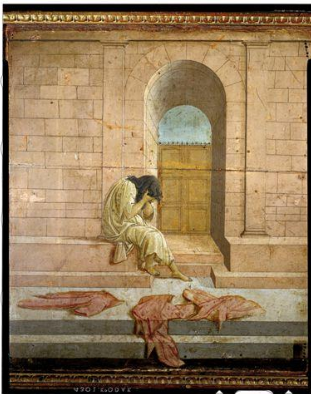
Filippino Lippi, Disperazione di Mardocheo