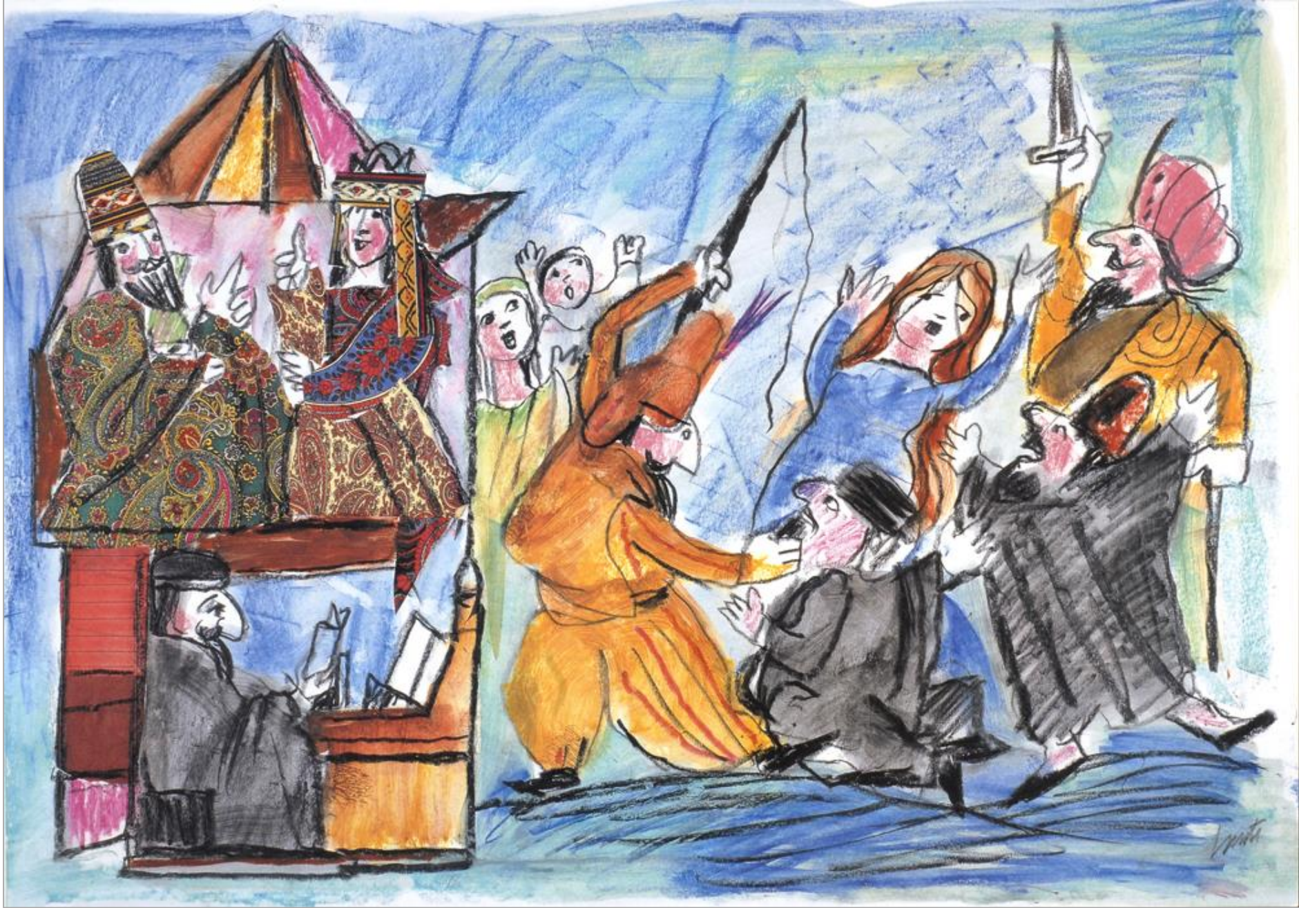
Emanuele Luzzati, L'editto di Aman