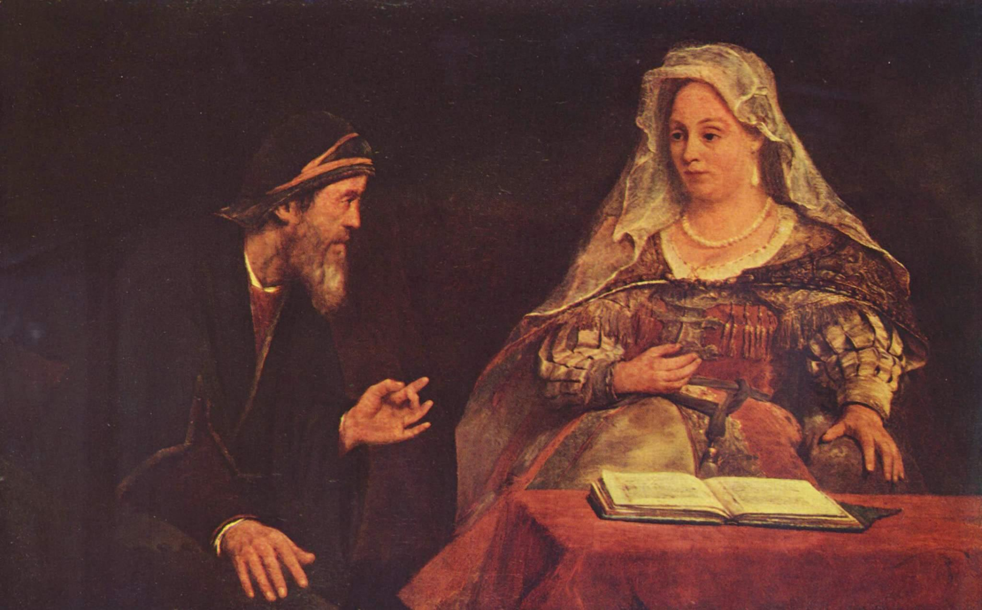
Aert de Gelder, Ester e Mardocheo