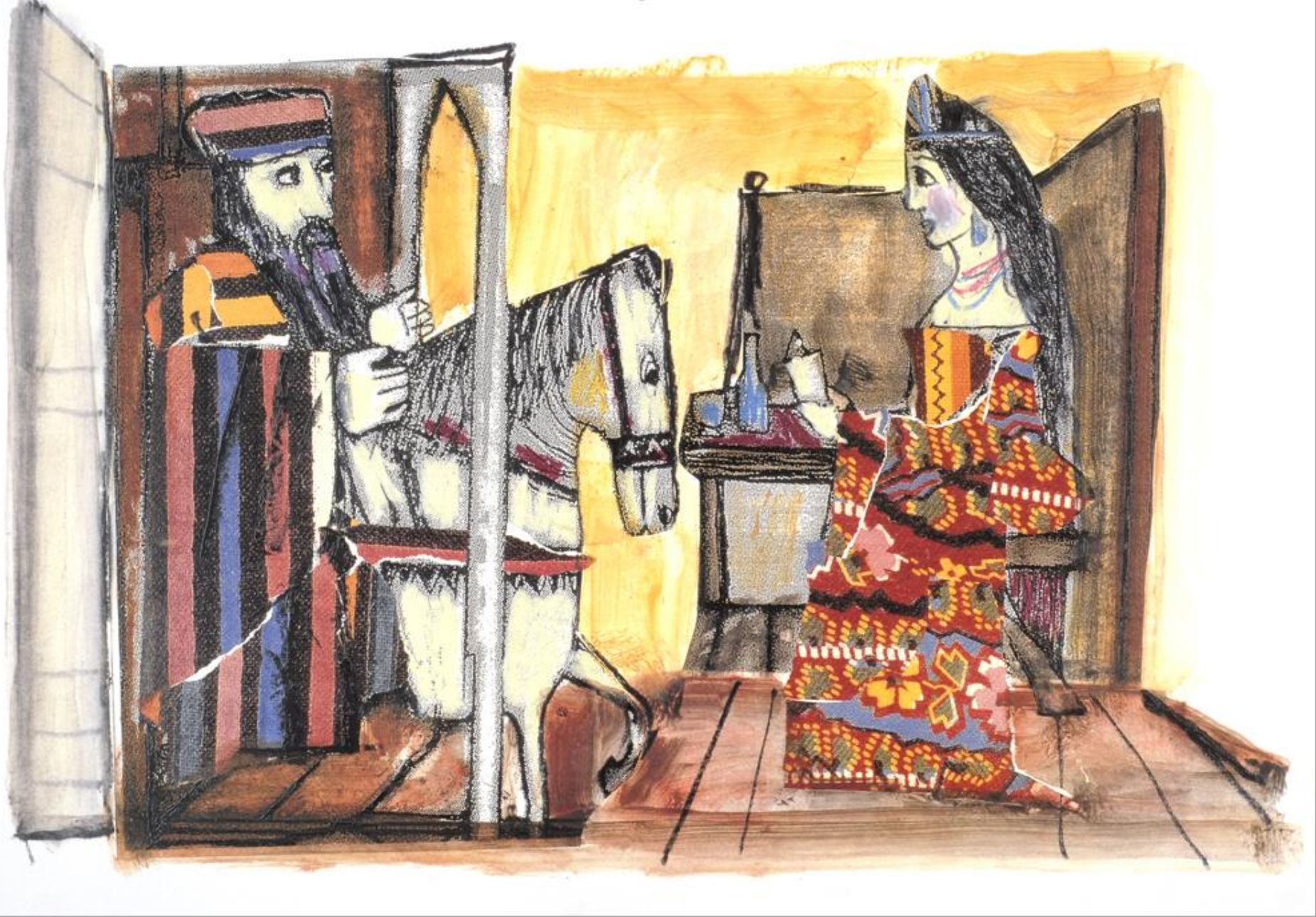
Emanuele Luzzati, Il digiuno di Ester